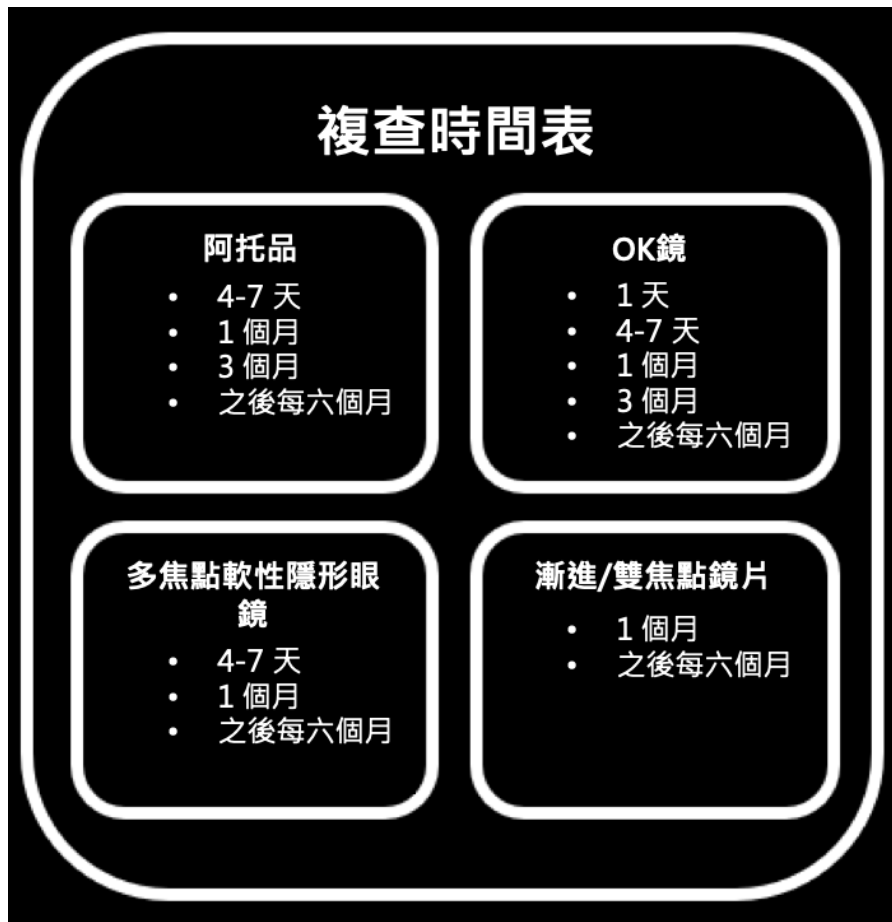
圖2：不同療法的複診計劃

Reference: Gifford KL, Richdale K, Kang P, Aller TA, Lam CS, Liu YM, et al. IMI - Clinical Management Guidelines Report. Invest Ophthalmol Vis Sci. 2019;60(3):M184-M203. https://iovs.arvojournals.org/article.aspx?articleid=2727312