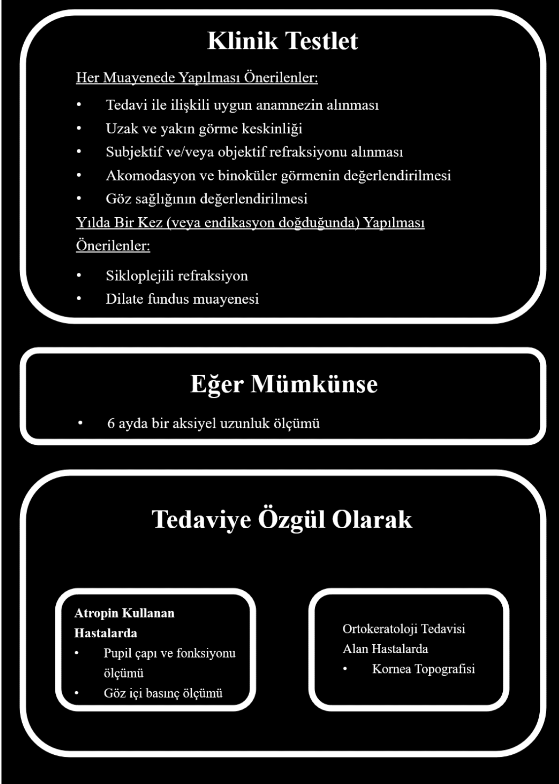
Şekil 1. Miyopi yönetimi için önerilen klinik testler.